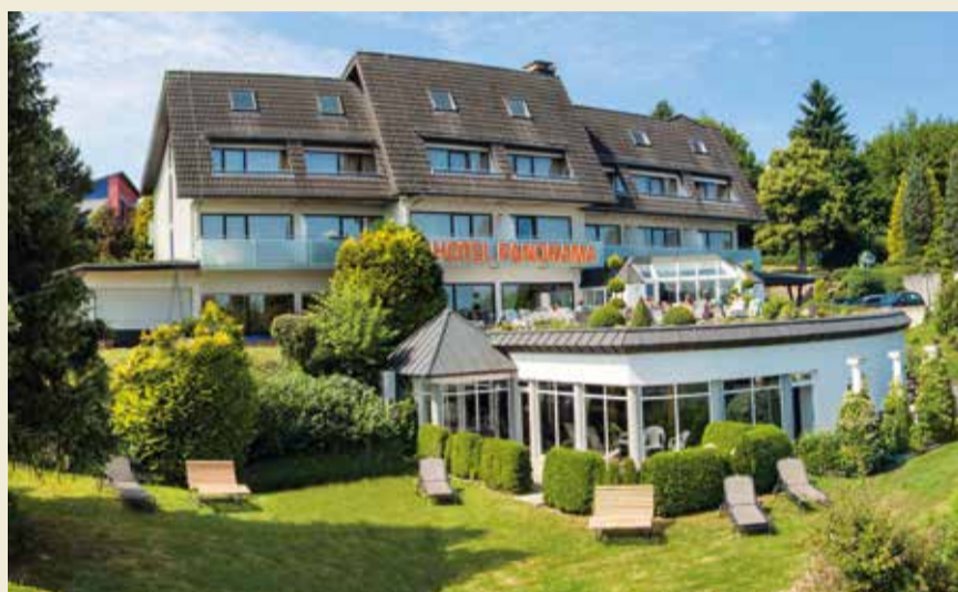
Doppelzimmer „Panorama“ mit Stadtblick, Zimmergröße ca. 24 m 2 und Balkon