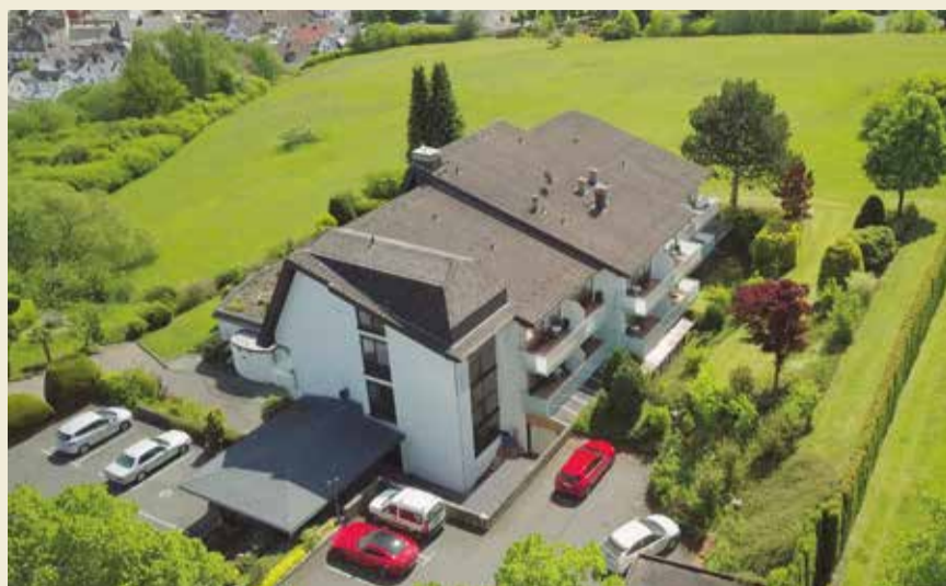
Doppelzimmer „Wehrbüsch“ · Südwestseite mit Blick ins Grüne, Zimmergröße ca. 24 m 2 und Balkon