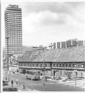
Das Hochhaus vor den umfangreichen Umbauten zum CITY HOTEL AM CCS.

Das Zentrum von Suhl erlebte ab den 60er Jahren große bauliche Veränderungen. Der Bau des Hochhauses bildete Ende der 70er Jahre im wahrsten Sinne des Wortes den Höhepunkt. Innerhalb weniger Jahre entstand das