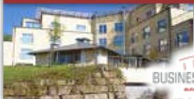
***** BUSINESS-VITAL-HOTEL am Kranzberg Wir leben, was wir tun.

Alternativ genießen Sie im „ Business-Vital-Hotel “ eine mediterrane, leichte Küche für Ihre „Vitalität“.