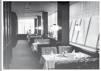
Das in der 26. Etage gelegene Panoramacafé vor dem Umbau des Hauses.

Am 1. Juni 1998 konnte das Hotel, das mit seinen 79,20 Metern noch immer das höchste Gebäude der Stadt ist, eröffnet werden.