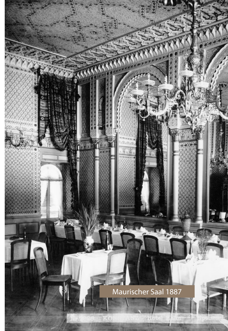
Maurischer Saal 1887

Der „Maurische Saal“, mit seinen orientalischen Dekorationsformen, der zu den herausragenden Hotelinterieurs des 19. Jahrhunderts („Belle Epoque“) am Bodensee zählt, ist eine Spielart des Historismus und steht für exotisches Fernweh und kosmopolitisches Bildungsideal von Adel und Bürgertum des 19. Jahrhunderts.