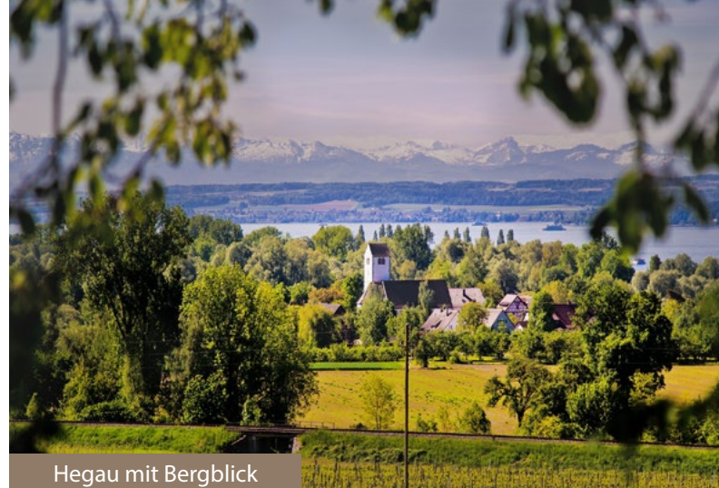
Hegau mit Bergblick