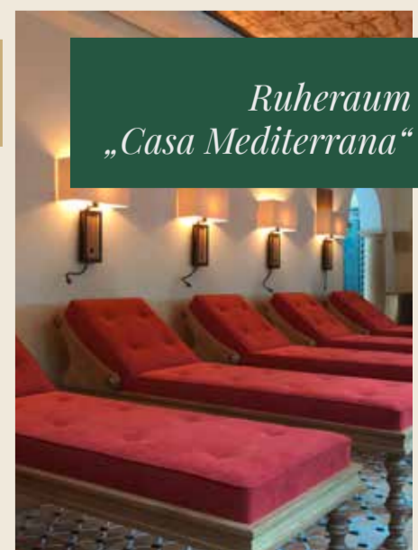
Ruheraum „Casa Mediterrana“