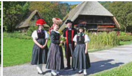
Schwarzwälder Freilichtmuseum Vogtsbauernhof

Ob Mountainbike, E-Bike oder Trekkingrad, interessante Touren finden Sie bei uns direkt vor der Haustür und in unmittelbarer Nachbarschaft einen Bikeshop, bei dem Sie Räder ausleihen können.